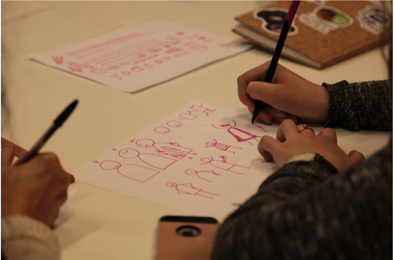
Workshop Visuals at Work, een samenwerking met Curious Piyuesh op 8 mei in Innovation Space (TU/e).