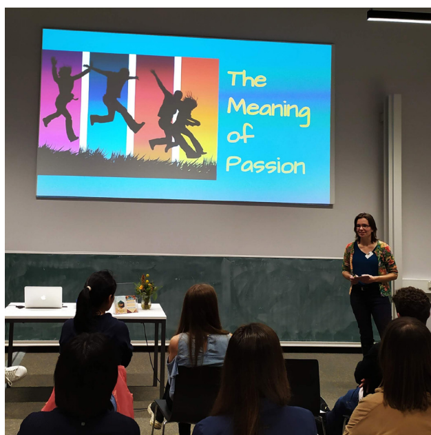
"Passionate about your future" workshop op 14 oktober, in Innovation Space (TU/e).