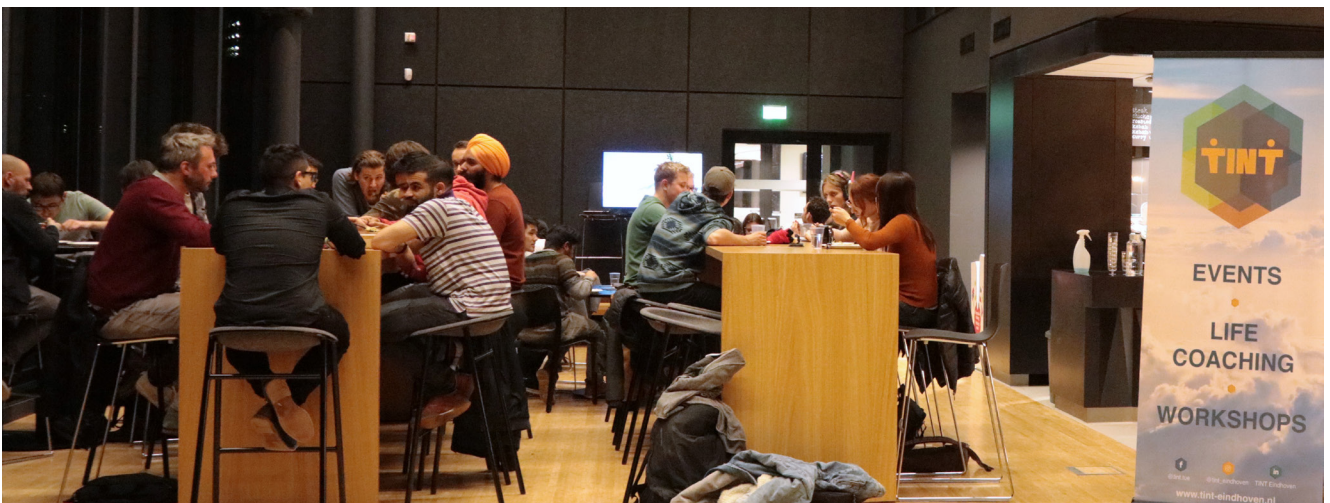
“Who Do You Think You Are” evenement op 26 november in het Atlas Restaurant (TU/e).