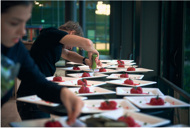
Emotional Alchemy Dinner op 2 oktober in het Atlas Restaurant (TU/e), een samenwerking met Enter The Now.