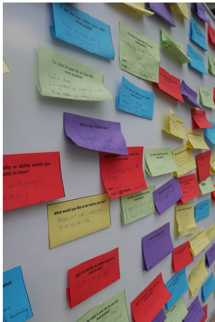
Vragen en antwoorden van de eerstejaars Bachelor studenten tijdens de TU/e Intro Week.

Vanuit daar is geconcludeerd dat de zichtbaarheid van Credo op de TU/e campus verhoogd moest worden. Het uitvoerend bestuur van Credo zou gaan bestaan uit één bestuurslid van elke aangesloten vereniging en Credo zou voortaan 3 evenementen organiseren, of aansluiten bij de door TU/e georganiseerde activiteiten zoals de kerstmarkt en een evenement genaamd 'Connect with my Culture'.