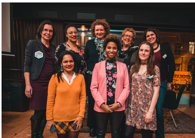
"Celebration of Women in Science" een samenwerking met Women In Science Eindhoven (WISE) in The Hub.

Het aanbod varieert van grote events zoals 'Celebration of Women in Science' met een aanwezigheid van zo'n 85 studenten - tot workshops zoals 'Personal Vision Board' en 'Who do you think you are?' waar de life coaches de inhoudelijke leiding namen. Ook sloot TINT aan bij verschillende universiteitsbrede activiteiten, waaronder de Introweek en 'Connect With My Culture'. Gemiddeld hadden de eigen georganiseerde evenementen 25 aanwezigen. We bereikten een totaal van 1738 studenten in 2019. In de bijlage van dit verslag wordt een overzicht van alle activiteiten gepresenteerd genaamd " Jaaroverzicht events 2019 ". Ervaringen over de evenementen, geschreven door studenten die als vrijwilligers optraden, zijn te lezen op https://www.tint-eindhoven.nl/blog/events/ .