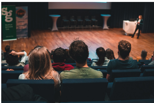
"Superpowers of M/F Scientists" een samenwerking met Studium Generale op 13 maart in Blauwe Zaal, Auditorium (TU/e)